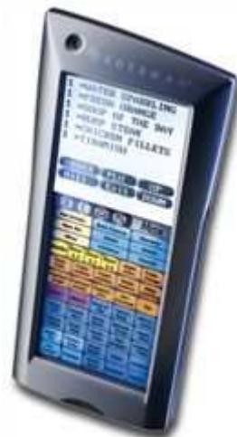
6: Orderman MAX 2

ORDERMAN MAX 2: Der „Sunnyboy“ der Orderman Crew - kontrastreich, hell und blendfrei auch im gleißenden Sonnenlicht - erobert die Szene. Das sonnenlichttaugliche Display funktioniert immer, drinnen und draußen! Dazu die bedienerfreundliche Eingabe mit Stift und Touch – für maximalen Komfort und Geschwindigkeit. Seine ausgereifte Technik und maximale Funktionalität verrät den Spezialisten und macht ihn so attraktiv für die verschiedensten Typen von Lokalen!