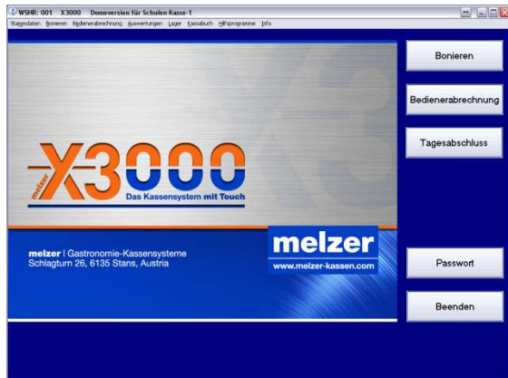
1: X3000 Hauptmaske

X3000 ist das Restaurant Abrechnungs- und Kontrollsystem für den modernen Unternehmer.